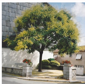
Quel est son nom ?