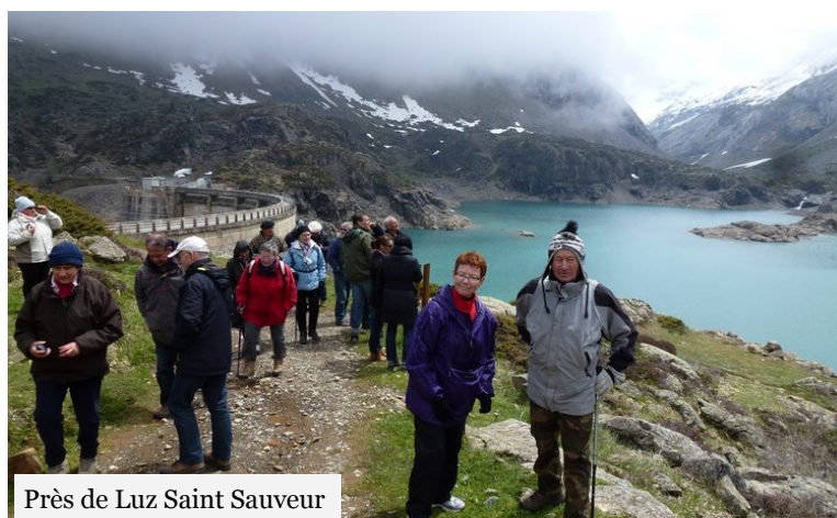
Près de Luz Saint Sauveur