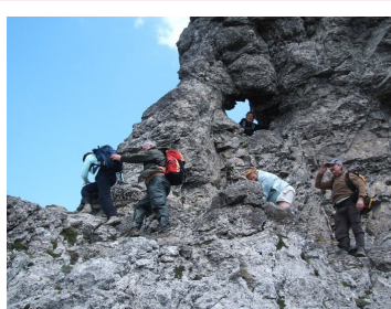
Caminaires à l'assaut de Bugarach