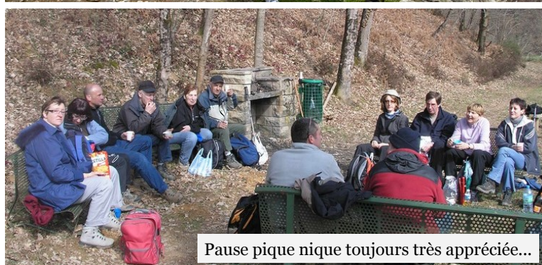
Pause pique nique toujours très appréciée...