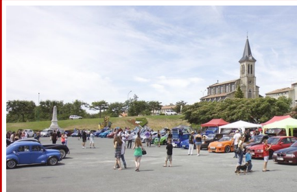
Expo tuning à Lacrouzette