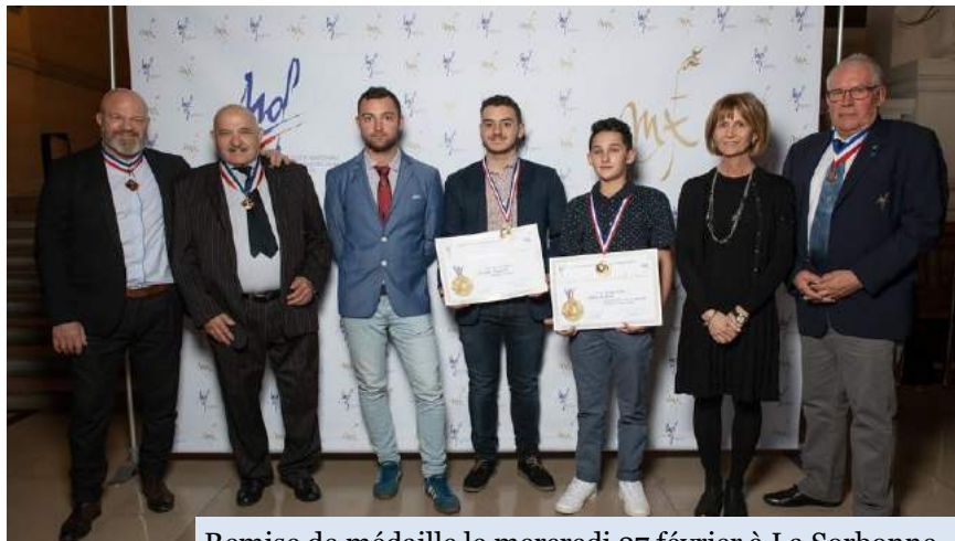
Remise de médaille le mercredi 27 février à La Sorbonne

Nous félicitons ce jeune passionné et lui souhaitons une longue route, qui se poursuit à l'Académie des Arts d'Avignon, pour se perfectionner et parfaire sa polyvalence.