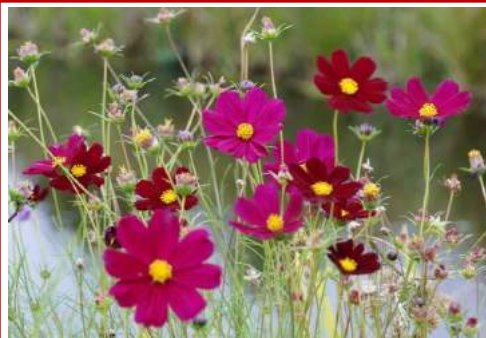
Il est arrivé... Le printemps...