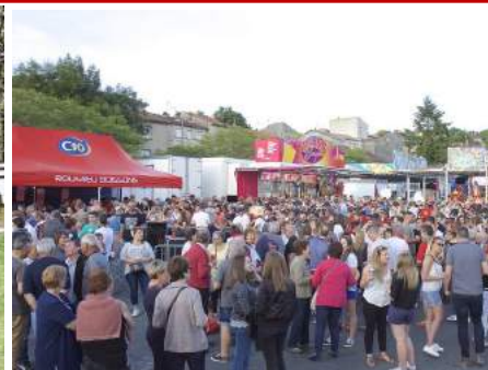
Du 30 mai au 2 juin : c'est la fête !