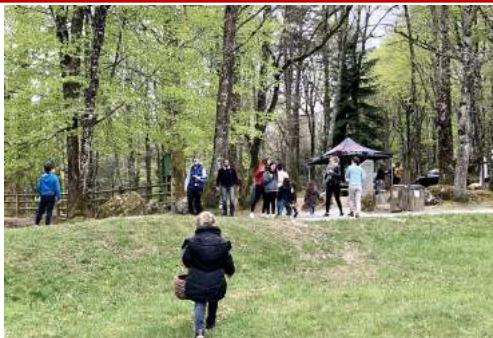
Cueillette des œufs de Pâques à Beyrès