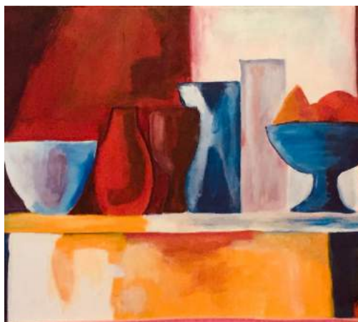
Prix de peinture à l'huile pour Chantal Curel