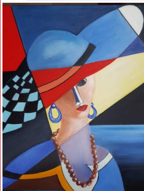
Prix de peinture à l'huile pour Solange Marc

Les élèves de l' Atelier ART SIDOBRE ont participé au Salon de peinture de Brousse. Grande fierté pour Roberte Soulié puisque trois d'entre elles ont été mises à l'honneur :