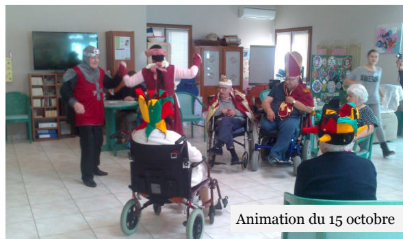
Animation du 15 octobre