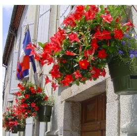
La mairie fleurie