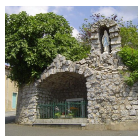
Grotte de Campselves