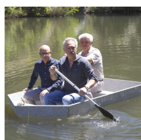
Barque en granit