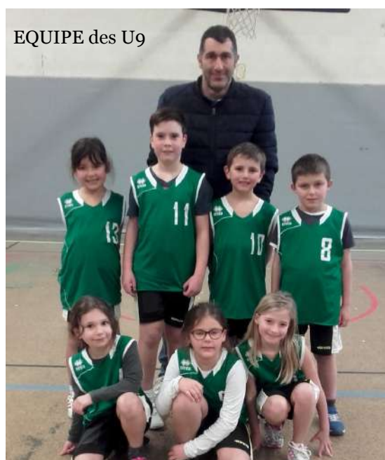
EQUIPE des U9

Le Lacrouzette Sidobre Basket vous souhaite une très belle année.