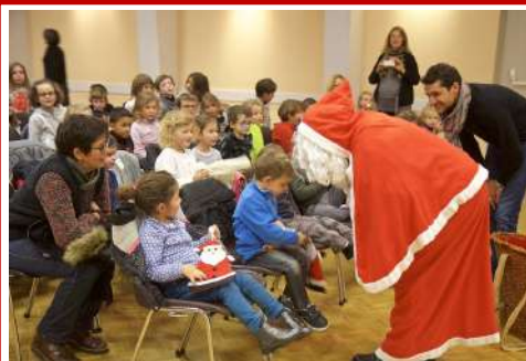
Noël des enfants...