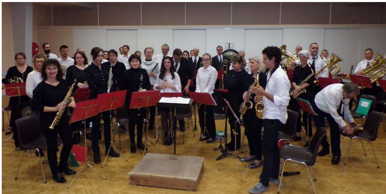
Le concert de Sainte Cécile a eu lieu à Lacrouzette le dimanche 26 novembre au foyer rural.

Merci à tous ceux qui contribuent, souvent dans l'ombre, à la réussite de notre ensemble.