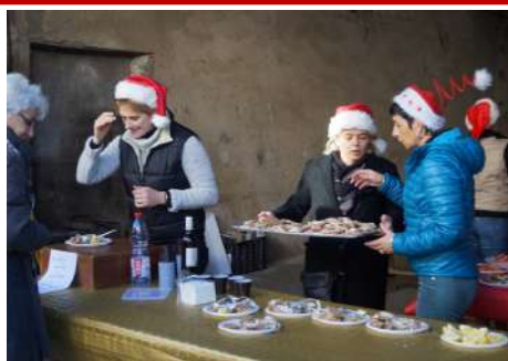
Noël des plus grands...