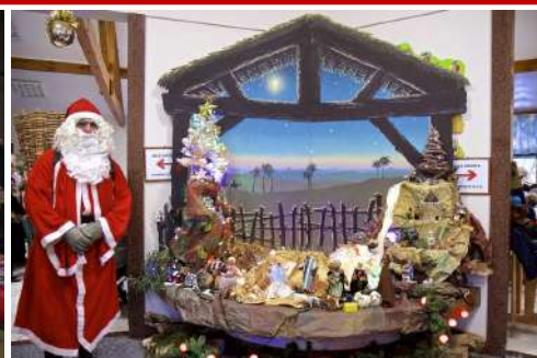
Et Noël des aînés au Mailhol...